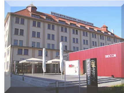
Technologiepark / UmweltPark im ehemaligen Heinsteinwerk (Blick aus NE)